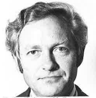
Professor, dr. jur. Ole Espersen, MF - Socialdemokratiet.