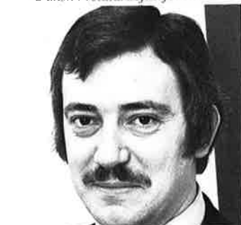
Cand. polit. Uffe Ellemann-Jensen, MF - Venstre.

Diskussionen starter direkte med spørgsmål til panelet fra repræsentanter valgt af arbejdsgrupperne. Der bliver ingen indledningsrunde. Panelet slutter af med en kort sammenfatning fra hver deltager.