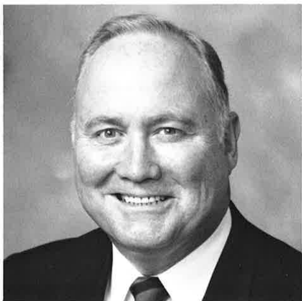
General H. Norman Schwarzkopf

General H. Norman Schwarzkopf sluttede sin militære løbebane som Commander in Chief, United States Central Command, MacDill Air Force Base, Florida. Han har gennemgået et uddannelsesforløb omfattende Valley Forge Military Academy og US Military Academy at West Point, New York, sluttende i 1956. Den militære karriere førte ham rundt til en række poster i USA, og i denne periode fik han en Masters Degree i Guided Missile Engineering på University of Southern California.