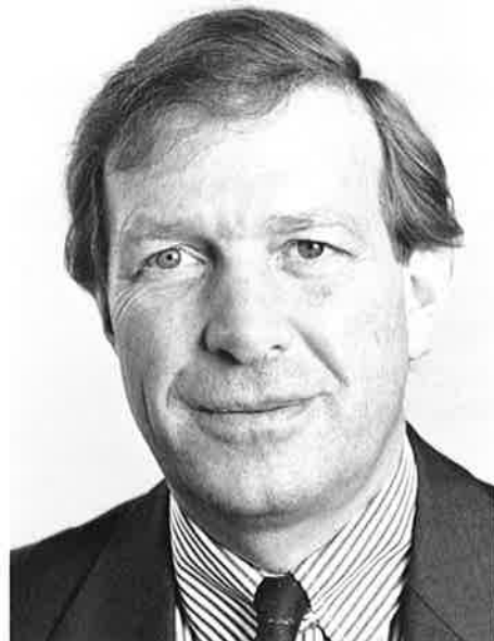
Dr. Günter Rexrodt, Treuhandanstalt