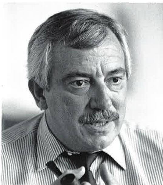
Udenrigsminister Uffe Ellemann-Jensen

Men hvo intet vover... Og det gjorde vi.