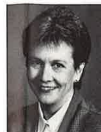
Dir. Jette Knudsen, Fredericia Bryggeri.

mellem deltagerne samt med medarbejdere og kunder i branchen for Industriel Automation.