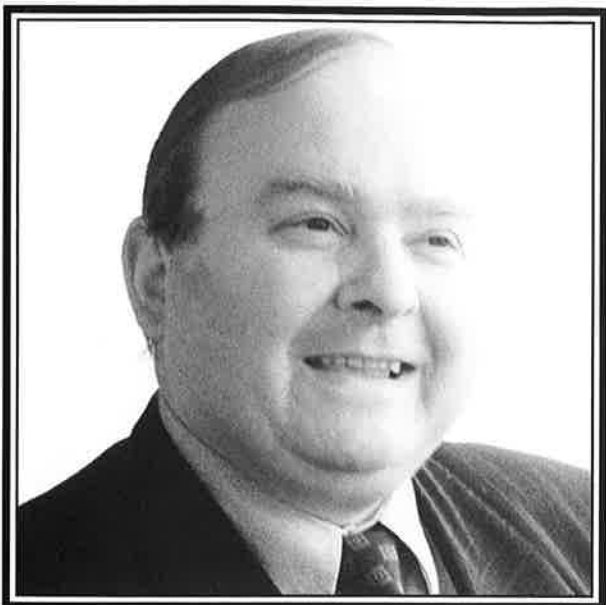
EF-kommissær Henning Christophersen