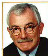
Forhenværende udenrigsminister Uffe Ellemann-Jensen

Det er en stor glæde for arrangørerne, at forhenværende udenrigsminister Uffe Ellemann-Jensen har indvilliget i at være aftenens festtaler. Uffe Ellemann-Jensen var udenrigsminister, da Muren faldt, og har om nogen engageret sig i EU's udvidelse. I dag sidder han blandt andet i bestyrelserne for Skandinavisk Tobakskompagni i Letland samt en række A. P. Møller – Mærsk selskaber i Estland, Letland, Litauen og Polen.