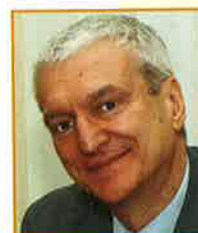
Professor Michal Kleiber, Minister of Science, Polen