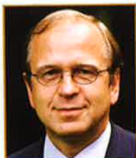
EU-kommissær Erkki Liikanen